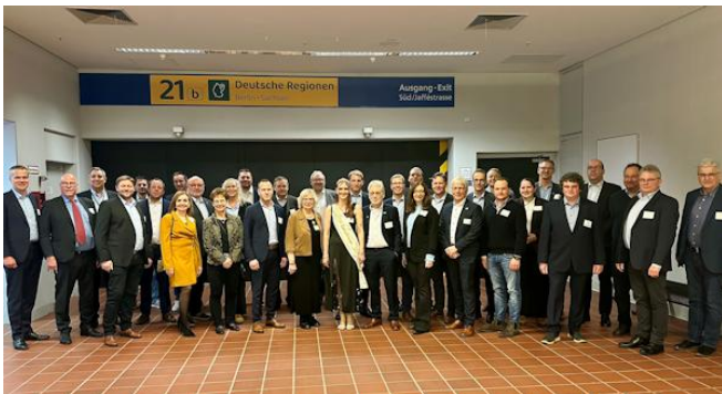
Traditionelles Foto mit dem Landvolk Mittelweser und der Nienburger Spargelkönigin