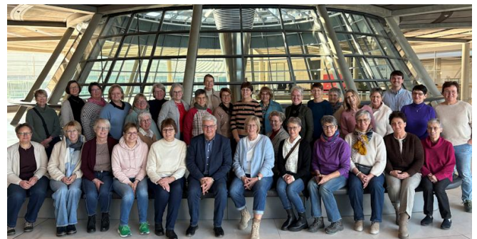
Mit dem Vorstand des Landfrauen-Kreisverbandes Grafschaft Hoya sowie Ortsvertreterinnen aus den Ortsvereinen Bassum, Twistringen, Harpstedt-Heiligenrode, Syke und Hoya , die ich zu einem Bundestagsbesuch im Rahmen ihrer Berlin-Reise eingeladen hatte.

Fazit zu 100 Jahre Grüne Woche: alljährlich ein wichtiger Termin für den fachlichen Austausch, der zugleich die hochwertige Bandbreite niedersächsischer Agrarprodukte und die Leistungen unserer Landwirte verdeutlicht!