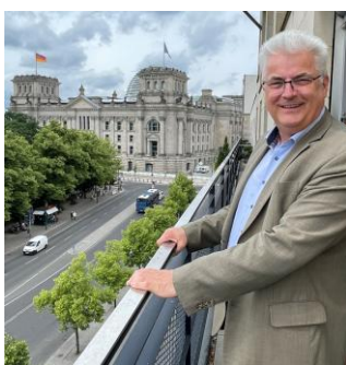
Bild: In dieser Woche begleitete mich der Fotograf Sigi Schritt aus Weyhe in Berlin.

Außerdem hat sich der Koalitionsausschuss mit Wirtschaftsverbänden und Gewerkschaften getroffen, um gemeinsam wieder für Aufschwung am Standort Deutschland zu sorgen. Es ging um notwendige Reformen für mehr Wachstum und Beschäftigung. Angesichts des technologischen Wandels und vielfältiger Krisen in der Welt stehen wir vor großen Herausforderungen. Wichtig für Wirtschaft und Arbeit sind u.a. mehr Bürokratieabbau, die Sicherung der Sozialversicherungen und die Gewissheit, dass Arbeit sich weiterhin lohnt.